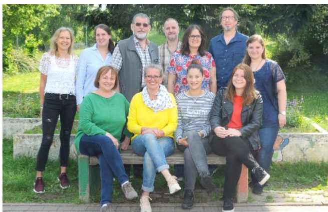
Kollegium im Juni 2018